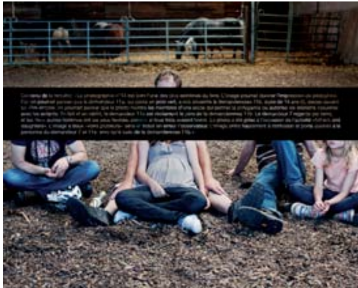
Christian Lutz exposera sa série In Jesus Name à la Chapelle de Régusse