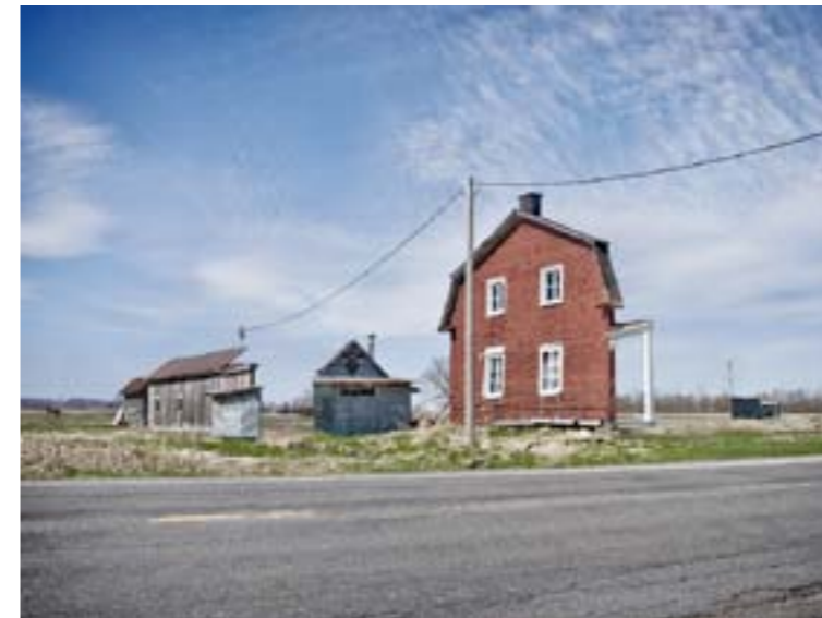
Zacharie Gaudrillot-Roy - Facades